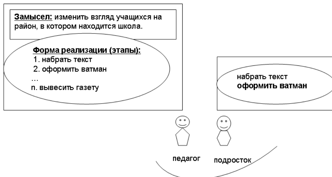
Рис. 3. Различие в представлении цели педагогом и подростком.

Анализ особенностей цели. Цель в данном случае у ученицы не сформировалась, так как не было осознания ни норм, ни ценностей, ни анализа ситуации, ни осознания социального целого. Ученица включилась в изготовление стенгазеты, поскольку ее интересовал один из этапов производства (рис. 3).